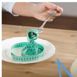
Spis i Restoen